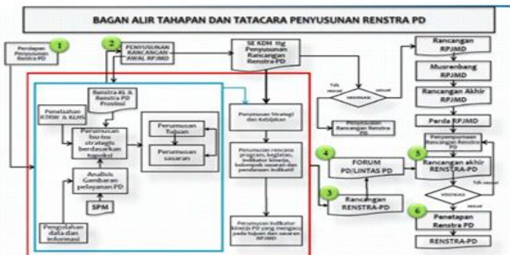
Gambar 1.1 Keterkaitan dan Tahapan Penyusunan Renstra PD Berdasarkan Permendagri Nomor 86 Tahun 2017

Berdasarkan uraian di atas, maka Kecamatan Pasimasunggu Timur Kabupaten Kepulauan Selayar sebagai salah satu SKPD di lingkungan Pemerintah Kabupaten Kepulauan Selayar menyusun dan menetapkan Renstra Kecamatan Pasimasunggu Timur Tahun 2021 - 2026 dengan berpedoman pada RPJMD Kabupaten Kepulauan Selayar Tahun 2021 - 2026. Selanjutnya Renstra Kecamatan Pasimasunggu Timur yang telah ditetapkan akan menjadi pedoman dalam penyusunan Rencana Kerja Kecamatan Pasimasunggu Timur yang merupakan dokumen perencanaan tahunan dan penjabaran dari perencanaan periode 5 (lima) tahunan